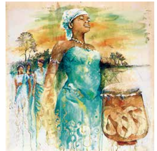
Foto: „Gran tangi di Mama Aisa (In gratitude to mother Earth)“ - Sri Irodikromo, © Weltgebetstag der Frauen – Deutsches Komitee e.V.

Am 2. März 2018 feiern wir rund um den Erdball den Weltgebetstag der Frauen aus dem südamerikanischen Surinam! Surinam, wo liegt das denn? Das kleinste Land Südamerikas ist so selten in den Schlagzeilen, dass viele Menschen nicht einmal wissen, auf welchem Kontinent es sich befindet. Doch es lohnt sich, Surinam zu entdecken: Der Weltgebetstag am 2. März 2018 bietet Gelegenheit, Surinam und seine Bevölkerung näher kennenzulernen. „ Gottes Schöpfung ist sehr gut! “ heißt die Liturgie surinamischer Christinnen, zu der Frauen in über 100 Ländern weltweit Gottesdienste vorbereiten. Frauen und Männer, Kinder und Jugendliche – alle sind herzlich eingeladen!